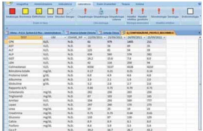
FIGURA 4 - Esempio di descrizione dell’andamento dei parametri del paziente tramite tabella. Immagine ottenuta dal software P.O.A. System 6 .

Qualcuno potrebbe pensare che questa eccessiva preoccupazione per la cartella clinica e per i “problemi” privi il medico del lato “umano” e limiti l’“arte” della pratica medica. Contrariamente a ciò, Weed afferma: “la cosa più umanitaria che un medico può fare è di essere perfettamente consapevole di ciò che sta facendo e informare il paziente, nella maniera più adeguata possibile, circa i problemi che lui ancora non è in grado di risolvere. Sono segnalate frequentemente gravi manchevolezze umanitarie e sociologiche dell’applicazione medica quotidiana, ma quasi tutte sono attribuibili ad un atteggiamento scarsamente scientifico; come ad esempio enfatizzare problemi non rilevanti e ignorare dati clinici essenziali per una corretta diagnosi e terapia. L’attività umana deve imporsi dei limiti; più l’arte è controllata e limitata, più l’attività medico-