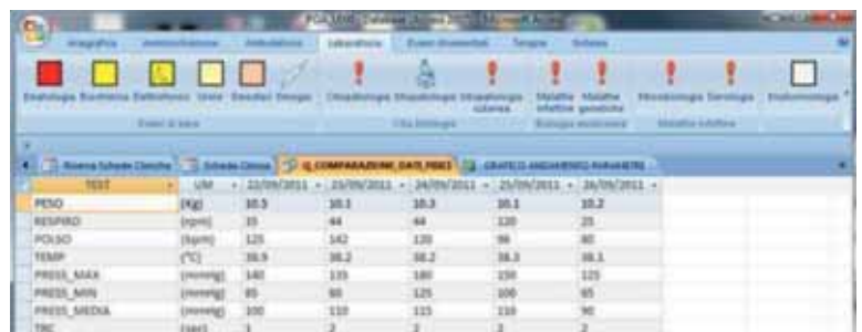
FIGURA 5 - Esempio di descrizione dell’andamento clinico tramite tabella. Immagine ottenuta dal software P.O.A. System 6 .